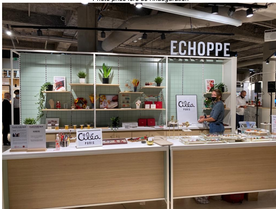
Photo prise lors de l'inauguration

Au sein de cet espace, l'INMA valorise les métiers d'art et du patrimoine vivant et propose aux clients une offre de haute qualité avec des produits uniques ou fabriqués en petites séries. Les clients peuvent aller à la rencontre des artisans pour découvrir leur savoir-faire et leurs créations.