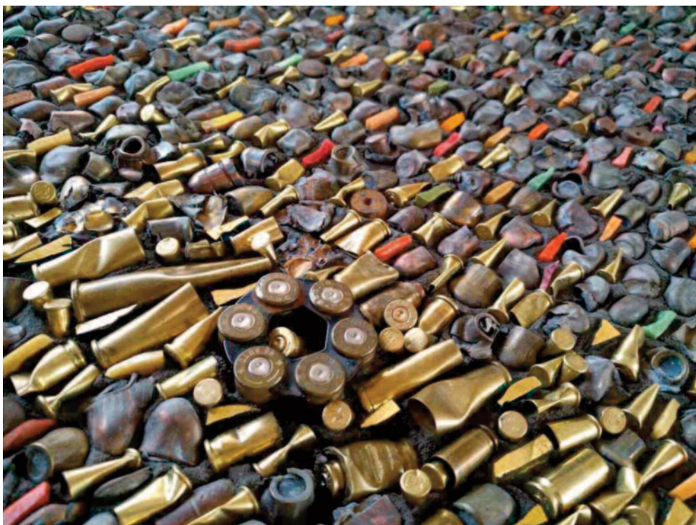
Balles perdues (détail)