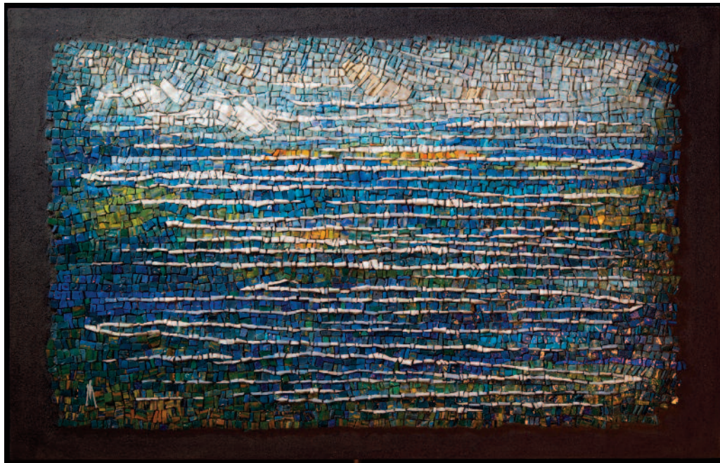
Sereno Dissolvimento (dissolution serene)