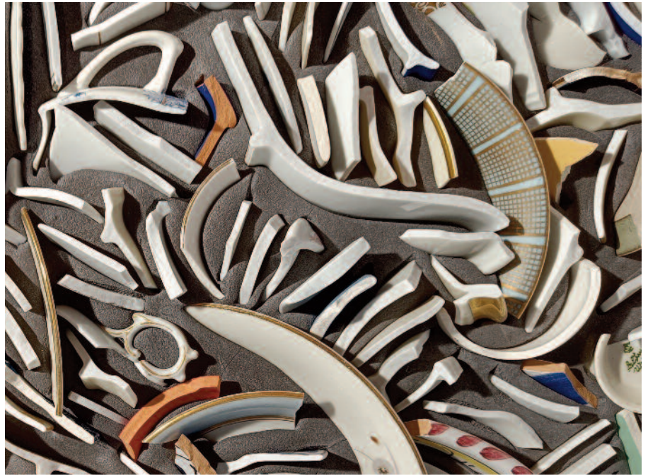
Color black (détail)